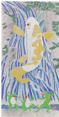
7. 「笑うコイとカエル」 5号